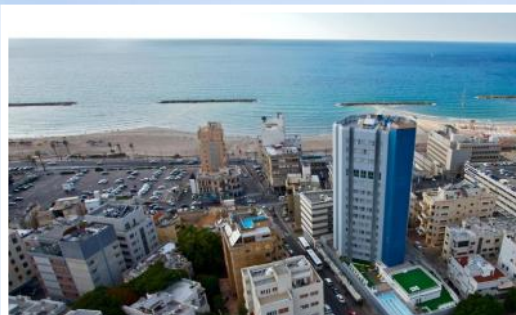
Metropolitan Hotell, Tel Aviv

Anmälan sker till Duveskogs Reseservice online på www.duvres.se eller ring oss på 0278-16005. När du fått din bokningsbekräftelse ska en anmälningsavgift på 1500 kr betalas inom 7 dagar (summan avdrages sedan vid slutfakturerings). I samband med att man betalar sin anmälningsavgift kan man också köpa till reseförsäkring och/eller ett avbeställningsskydd, som gör att man får nästan hela resan återbetald vid avbokning för t ex sjukdom, olycksfall etc. Läkarintyg erfordras.