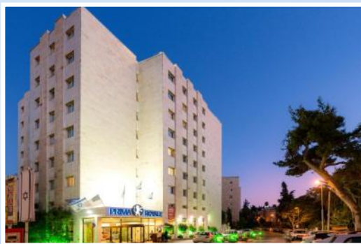
Prima Royale, Jerusalem