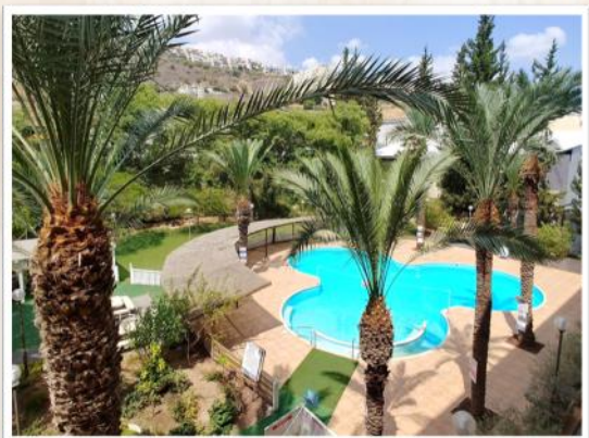
Restal hotel, Tiberias

Anmälan sker till Duveskogs Reseservice online på www.duvres.se eller ring oss på 0278-16005. När du fått din bokningsbekräftelse ska en anmälningsavgift på 1500 kr betalas inom 7 dagar (summan avdrages sedan vid slutfakturerings). I samband med att man betalar sin anmälningsavgift kan man också köpa till reseförsäkring och/eller ett avbeställningsskydd, som gör att man får nästan hela resan återbetald vid avbokning för t ex sjukdom, olycksfall etc. Läkarintyg erfodras.