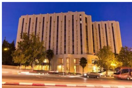
Royal Wing, Jerusalem

OBS! Avbeställningsskydd måste betalas in tillsammans med anmälningsavgiften