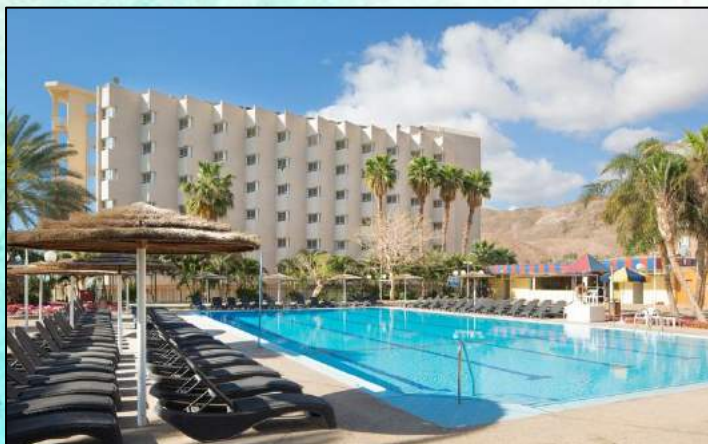
Nova hotell, Eilat