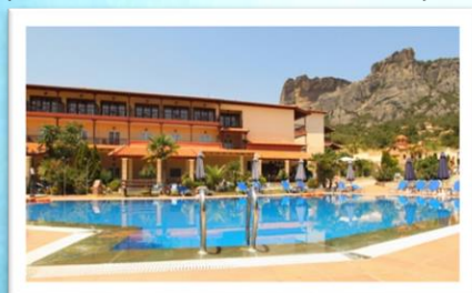
Famisi Eden Hotel