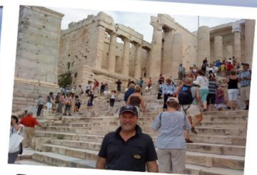
David i Athen