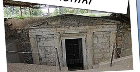
Gravplats i Verina