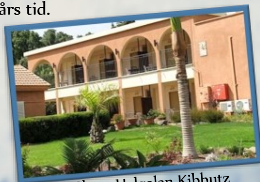
Shaar Hagan Kibbutz

Klimatkompensera resan? Javisst, läs mer på vår hemsida eller fråga oss!