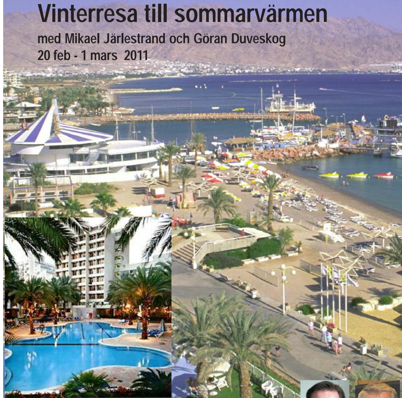
Hotell Cesar i Eilat

2 dagar i Jerusalem Bad i Döda Havet Sångkväll med Mikael Israelstudium med Göran Fritidsaktiviteter för barn & ungdom Extra utflykter: Båttur på Röda Havet, Dagsutflykt till klippstaden Petra, Möjlighet att besöka Mose berg i Sinai