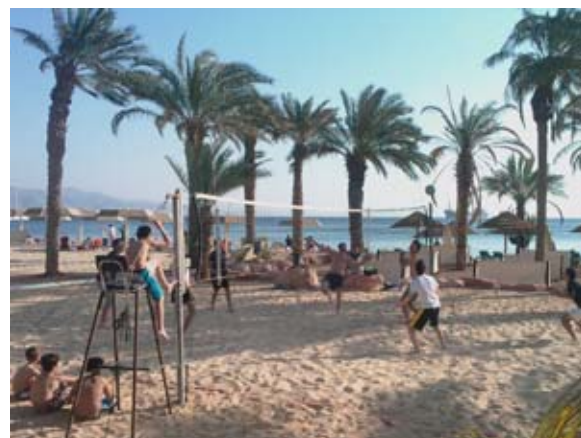
Vid intresse så ordnas Volleyboll vid stranden