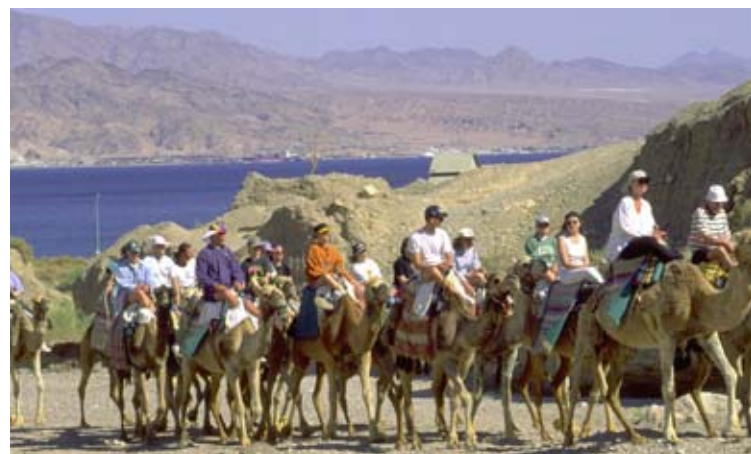
Passa på att besöka kamelranchen, och följ med på en fyrtimmars kamelridning i bergen runt Eilat, och avnjut kvällsmat bestående av nybakat bröd med getost under en stjärnklar himmel.