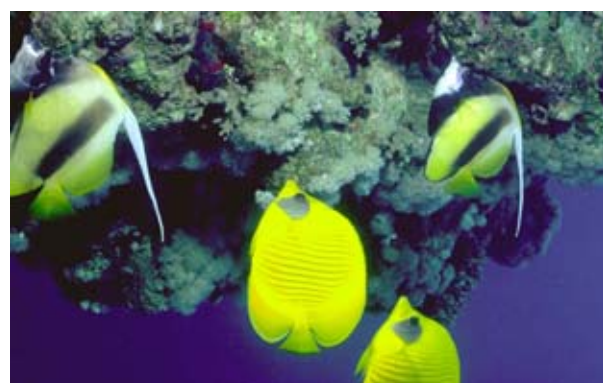
I Eilat finns en spännande värld under havsytan. Här kan man dyka bland koraller och simma med de färgrika fiskarna. I Eilat kan man även få simma med delfiner.