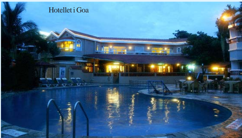
Hotellet i Goa